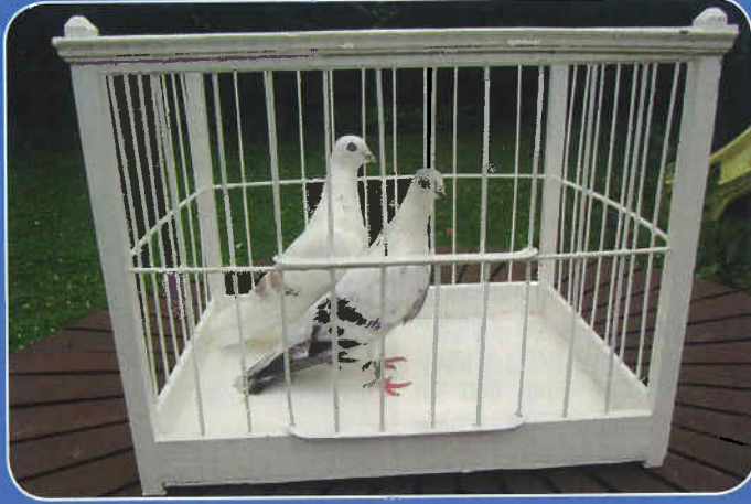
Rot- und „Dunkelgestrichte“ in einer original Ausstellungssteige von 1930