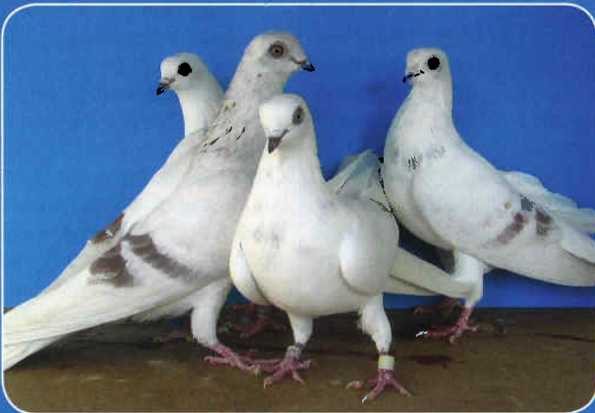
Gruppe Prager Hochflieger aus Prag; Foto: Traxler