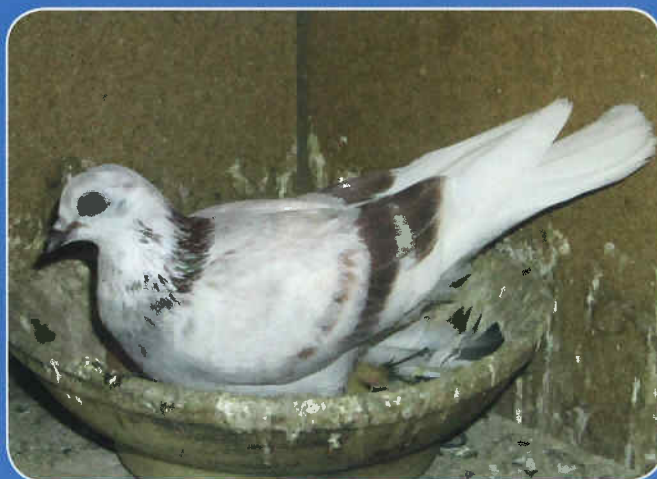
Rotgestricht-gepritzte Täubin aus der Zucht von Rumpler, Traiskirchen, Ö; Foto: Traxler