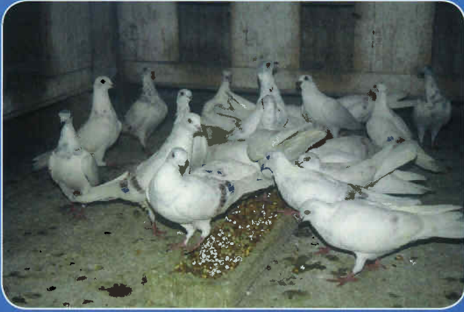
Schlossnickel Tauben