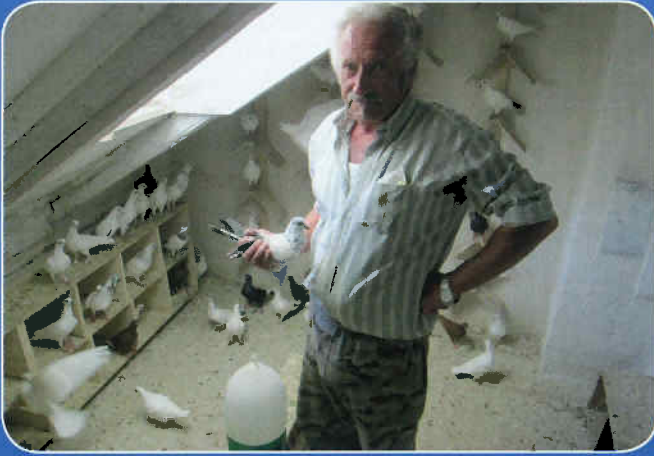
am Taubenboden des Hernalers Rudolf Küss in Schleinbach; Foto: Traxler

Klasse 49, Prager, gestrich 534 1.1 Drimmel Franz 535 1.1 " " Klasse 50, Schimmerln